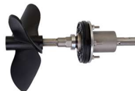
MEXEDOR MECÂNICO PARA BOMBA 75/100/150 – PARA TURBO ATOMIZADORES 1200 E 1500.