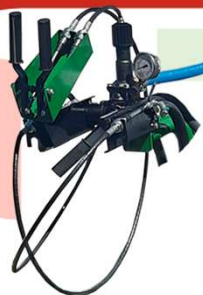
COMANDO VAR 02 VIAS A CABO

KIT TOWER (TORRE) TURBINA 750 mm 300 À 1500.