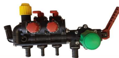
COMANDO MASTERFLOW MANUAL ARAG 02 VIAS