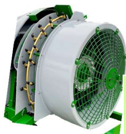
TURBINA 850 mm + BOMBA 100 SUB TURBINA 750 mm + BOMBA 75