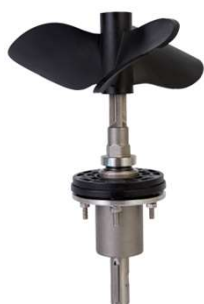
MEXEDOR MECÂNICO PARA BOMBA 75/100/150 – PARA TURBO ATOMIZADORES 1200 E 1500.