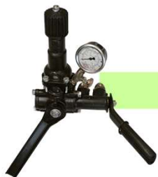
COMANDO VAR 02 VIAS