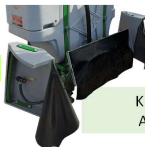
KIT HERBICIDA PARA TURBO ATOMIZADORES 3 PONTOS