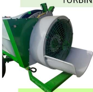
KIT TOWER (TORRE) TURBINA 750 mm 300 À 1500.