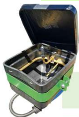
KIT INCORPORADOR DEFENSIVO

KIT RAMAL PARA MAMÃO PAPAIA PARA TURBINA DE 850 mm