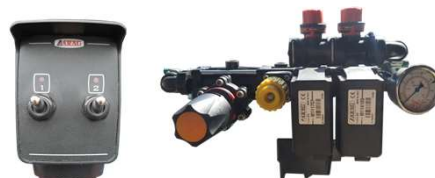
COMANDO MASTERFLOW ELÉTRICO ARAG 02 VIAS