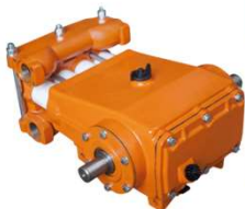
BOMBA IMEP 100 SUB 75

TURBINA 850 mm + BOMBA 100 SUB TURBINA 750 mm + BOMBA 75