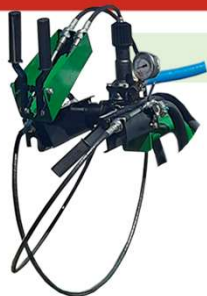
COMANDO VAR 02 VIAS A CABO