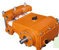
BOMBA IMEP 100 SUB 75