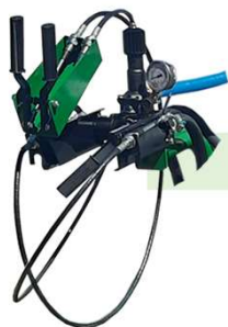
COMANDO VAR 02 VIAS A CABO