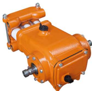
BOMBA IMEP 75 SUB 40