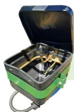
KIT INCORPORADOR DEFENSIVO